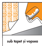
sub tapet și vopsea