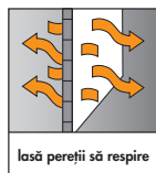
lasă pereții să respire